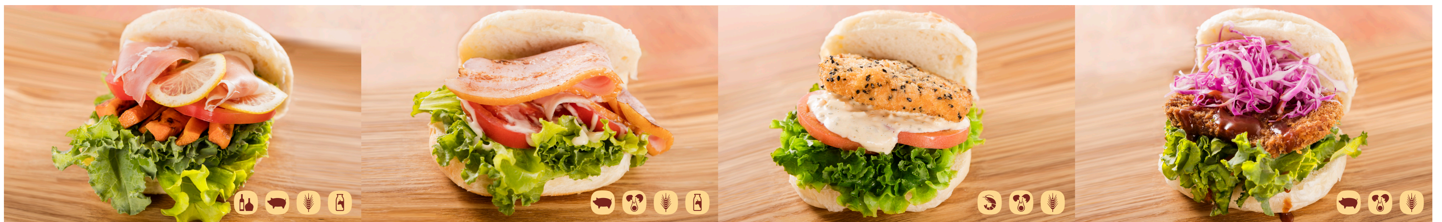
熊本県産火の本豚生ハム、人参のロースト、 国産レモンのサンドウィッチ Domestic Raw Ham, roast Carotte & Domestic Lemon Sandwich