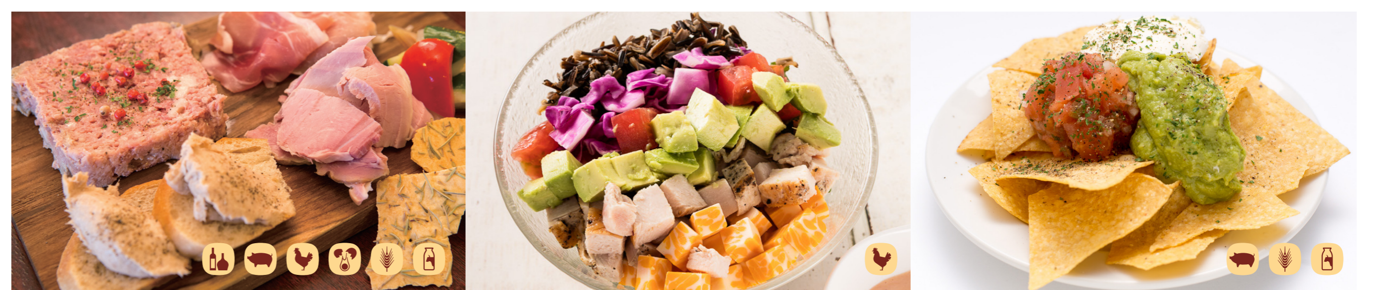
シャルキュトリーの盛り合わせ Assorted Charcuterie