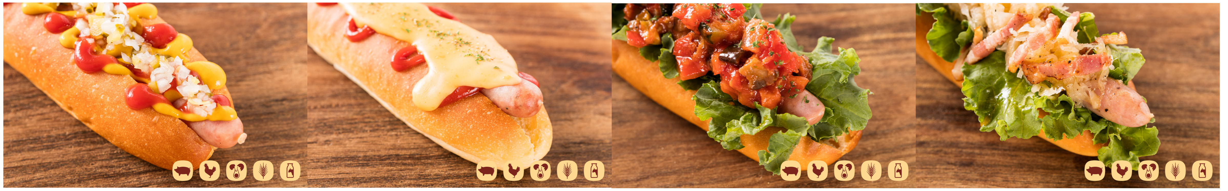
粗挽きソーセージのベーシックドッグ Basic Arabiki Hotdog