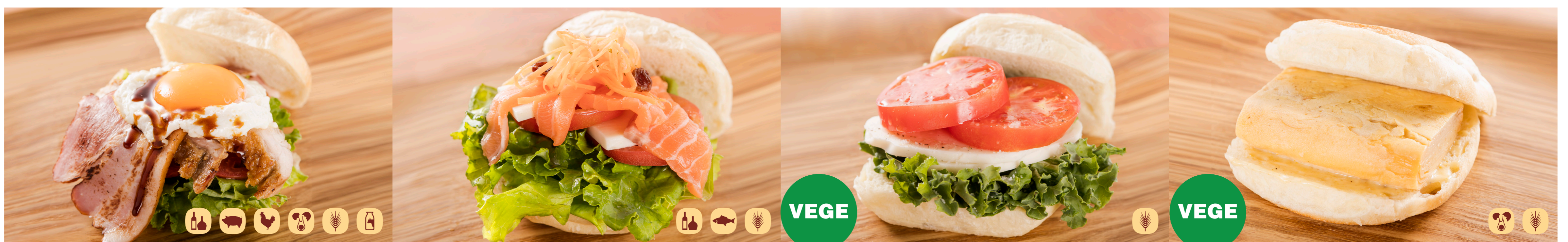
熊本県産火の本豚ベーコン・テリヤキチキンの クラブハウスサンドウィッチ Bacon & Chicken Club House Sandwich