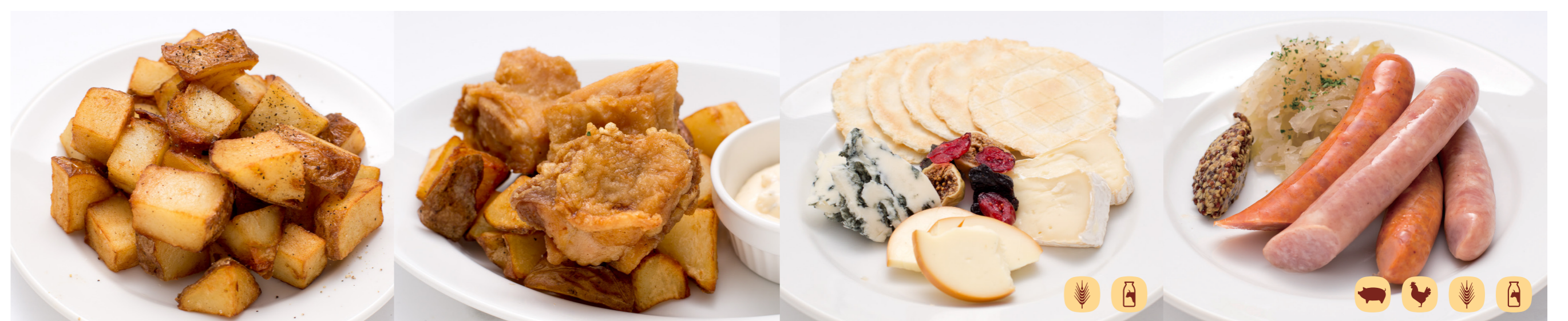
国産 皮付きポテトフライと チリソルト French Fries and Chili Salt